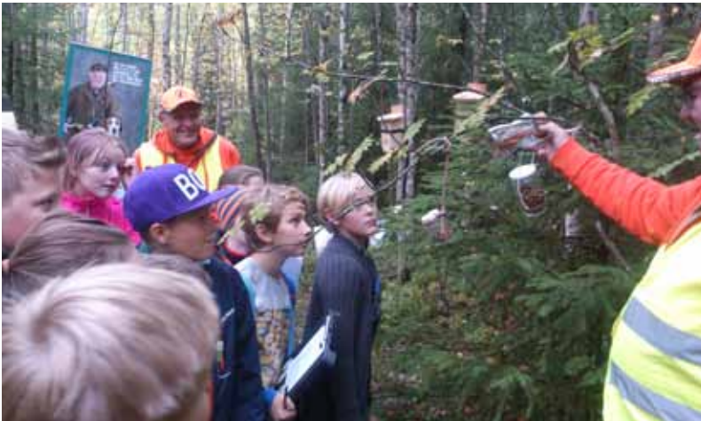
Elever från klass 5 i Sörforsskolan gissar på spillning från älg, tjäder, hare och järpe i olika burkar som hänger i "bajsträdet".