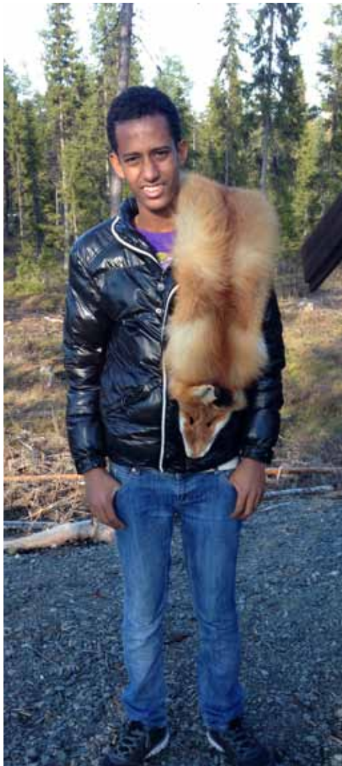
En av deltagarna blev väldigt förtjust i rävskinnet.

Under hösten bjöd Jägareförbundet Vilhelmina in till aktiviteter. Vid fyra träffar lyssnade deltagarna nyfiket på när jägare berättade om naturen, jägaren och jakten. Deltagarna fick även träffa älghunden Buck och se en älgstudsare. Som avslutning på Jägareförbundets aktiviteter var det 14 deltagare i alla åldrar som följde med på Älgsafari. Mer om projektet kan du läsa på: https://utvecklingsarenavilhelmina.wordpress.com/nyheter/idrott-for-alla/