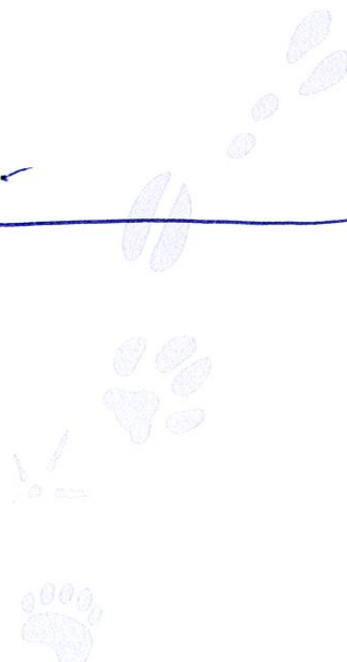
Ola Wälimaa Förbundsjurist