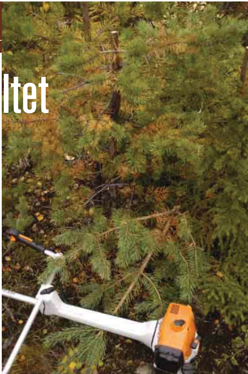
Vid toppning av tall måste man lämna kvar tre–fyra levande grenvarv under skäret, annars finns risk att trädet dör.

När en älg kommer in i en sådan ungskog orsakar den skada så snart den stannar och tar en tugga. Bryter den en topp uppstår en lucka i det framtida tallbeståndet. Blir skadorna mycket omfattande kanske skogsäga-