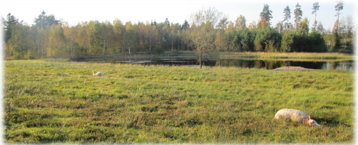
Vargdödade får.

Läs bifogade dokument: Jägareförbundets jurist om paragraf 28 samt Varg får skjutas i nödvärn.