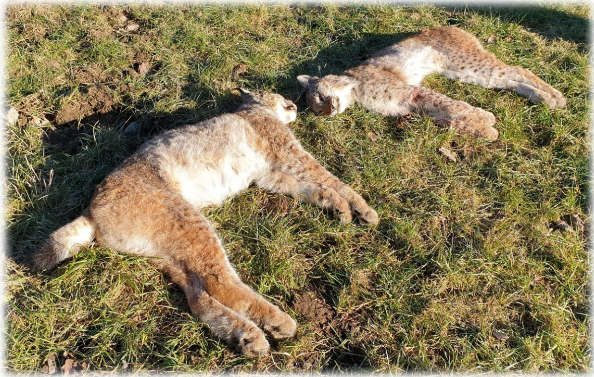
Licensjakten 2021.

ska jämföras med 6,83 som låg till grund för beslutet om jakt 2021. Jägareförbundet verkar för att området där jakt får bedrivas kommer att innefatta en så stor del av länet som möjligt. Jägareförbundet återkommer med inbjudningar till digitala möten inför jakten.