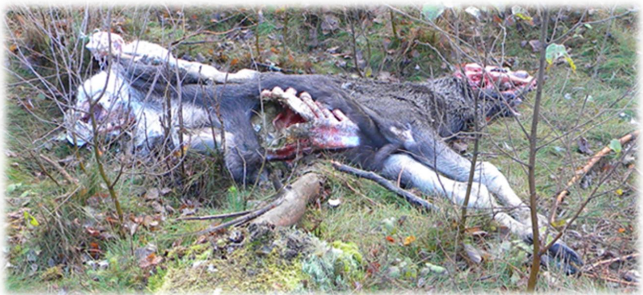
Vargdödad älgkalv.

Även tamdjurhållningen blir kraftigt försvårad och stora problem kan uppstå.