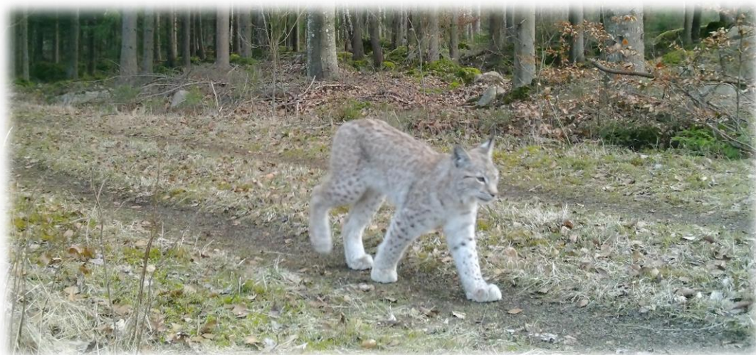
Lodjur på väg.

Så en uppmaning är att faktiskt ta till sig kunskap om rovdjurens biologi och aktuella frågor i förvaltningen samt spår och rörelsemönster. Ju mer vi vet desto bättre är det för alla inblandade. Det är också viktigt att sätta sig in i hur förvaltningssystemet fungerar eller åtminstone är tänkt att fungera. För det finns verkligen förbättringspotential i systemet, inte minst kopplat till vargen.