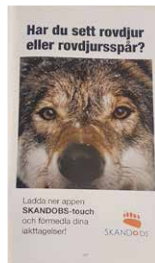
Bild 1: Annons om Skandobs i Jakttabellen för 2022-2023.

Ett flertal länsföreningar har tagit fram och distribuerat information rörande Skandobs och vikten av rapportering i olika former till medlemmarna. Detta kan röra sig om "lathundar" (hur man rapporterar), informationsblad, digitala utskick och information via hemsidor. Aktiviteterna skiljer sig något åt mellan län såväl utifrån behov, rovdjursförekomst och aktuellt berörda arter. Bild 2 får illustrera hur det kan se ut på lokal nivå.