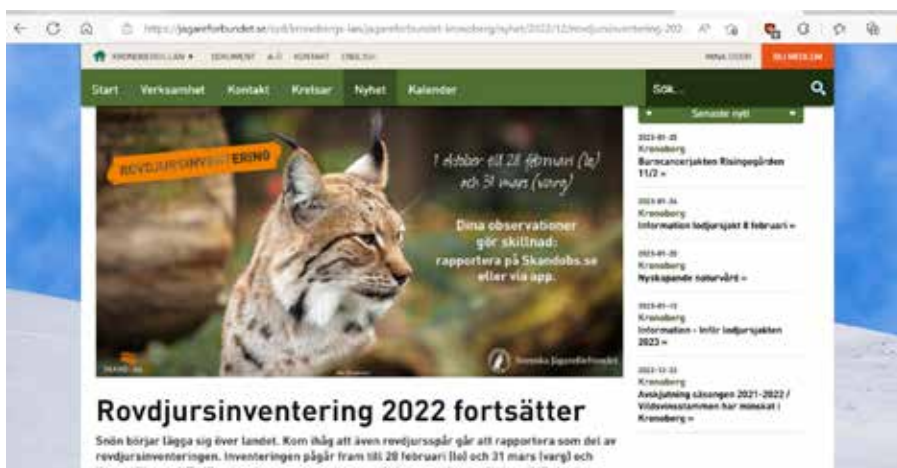
Bild 2: Information om Skandobs på Kronobergs läns hemsida under 2022.

Under 2022 marknadsförde även Svenska Jägareförbundet Skandobs på olika jaktmässor. Till följd av pandemin ställdes de flesta mässorna in 2021 varför denna verksamhet då uteblev. Som ett exempel på mässaktivitet såldes viltkameror till ett rabatterat pris och dessa marknadsfördes med ett rullande bildspel med bilder på lodjur och information om Skandobs.