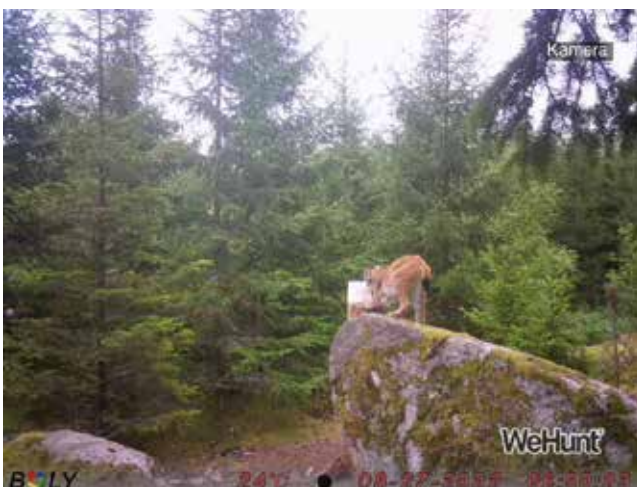
Bild 4. Under åren 2021 och 2022 har förbundet jobbat aktivt för att jägarna ska rapportera "spontana" bilder från viltkameror uppsatta i andra syften än rovdjursinventering.

Under februari 2021 genomfördes en områdesinventering efter lodjur i delar Uppsala län. Länsstyrelsen stod som ansvarig med stöd av Jägareförbundet vars kretsar var engagerade i den praktiska inventeringen. Engagerade på respektive krets utförde avspårning av vägar och vid fynd av spår kontaktades länsstyrelsen som skickade ut spårare för kvalitetssäkring. Rapporten vilken sammanfattar bland annat resultaten från denna inventering kan läsas HÄR eller på länsstyrelsens hemsida (sök på Inventering stora rovdjur).