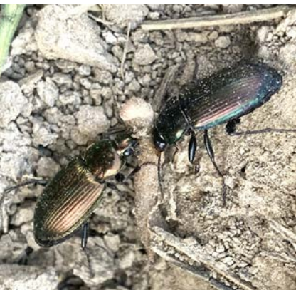
Kopparsollöpare tillhör de vanligaste jordlöparna i åkermark. De äter bladlöss och andra smådjur men även ogräsfrön.

Så skalbaggsåsen med tuvbildande gräs som timotej och hundäxing, eventuellt i kombination med örter som lusern, rödklöver, vitklöver och cikoria, för att även gynna fältvilt och pollinatörer. Du kan så för hand, med rampspridare, frölåda eller genom bredsådd. Putsa åsen en till två gånger första året för att minska förekomsten av rotagräs. Följande år putsar du skalbaggsåsen bara om och där det behövs.