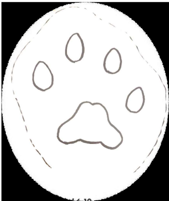
Lodjursspår – asymmetriska tår

Det krävs bra spårförhållanden för att genomföra inventeringen och att den ska bli bra. Jägareförbundet och länsstyrelsen beslutar under veckan att det finns förutsättningar för inventering.