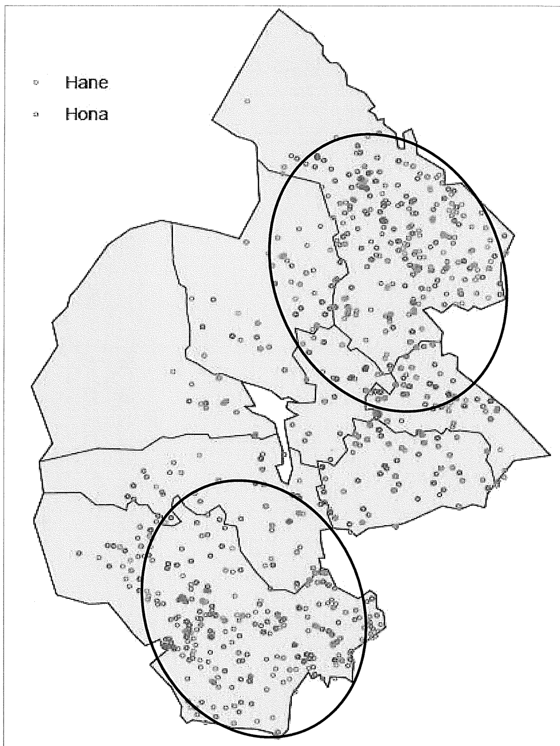
Figur 1: Översiktsbild över identifierade individer vid spillningsinventeringen 2020. Honor är markerade med blå cirklar medan hanar är markerade med röda. De svarta cirkelarna visar ungefärlig utbredning av kärnområden för honor (Naturhistoriska riksmuseet, 2021).