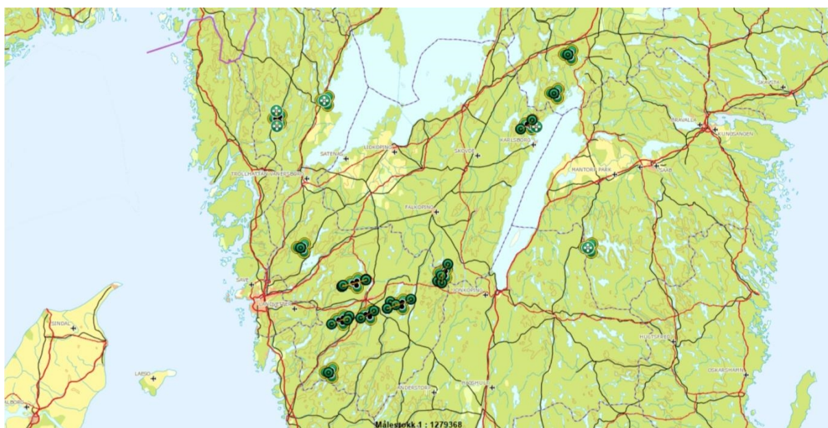
Figur 3. Markeringarna visar var i länet lodjursföringringar har kvalitetssäkrats under inventerings-säsongen 2019/2020.