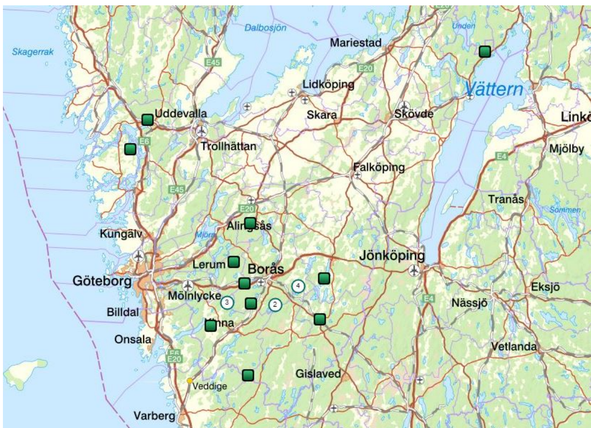
Figur 2. Markeringarna visar var i länet får har angripits av lodjur mellan den 1 maj 2020 och den 15 december 2020.