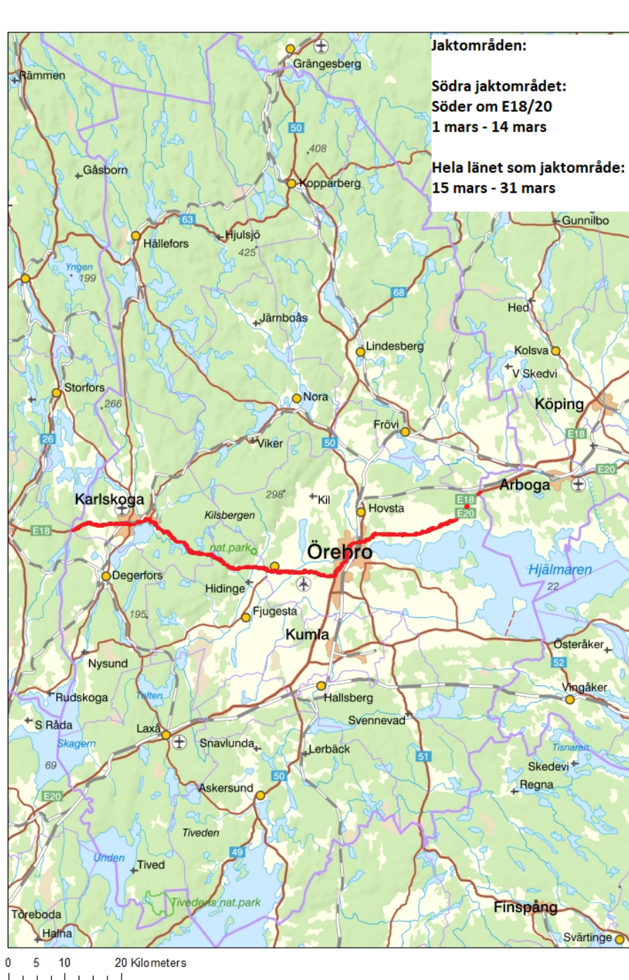
Figur 3: Kartbild över Örebro län. Den nordliga gränsen för det södra jaktområdet visas med en tjock röd linje. Licensjakt får ske i det södra jaktområdet under perioden 1 mars – 14 mars och därefter i hela länet under perioden 15 mars – 31 mars, eller till den tidigare tidpunkt då Länsstyrelsen avlyser jakten.