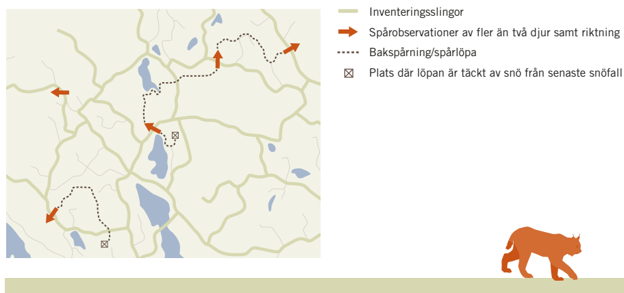
Figur 1. Bakspårning och ihospårning i teorin.

Spårningar av andra löpor bör göras samtidigt, men det måste ske innan nästa snöfall. Om olika spårlopor har gjorts av samma familjegrupp slutar de inte i snö från snöfallet på olika platser, utan den ena spårlopan kommer i så fall så småningom att spåras ihop med den andra, detta kallas då att observationerna spåras ihop (se figur 1. Bakspårning och ihospårning i teorin).