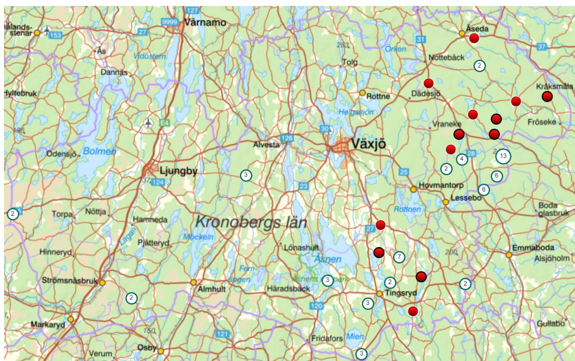
Kvalitetssäkrade vargobservationer i Kronoberg inventerings säsongen 2023–2024.