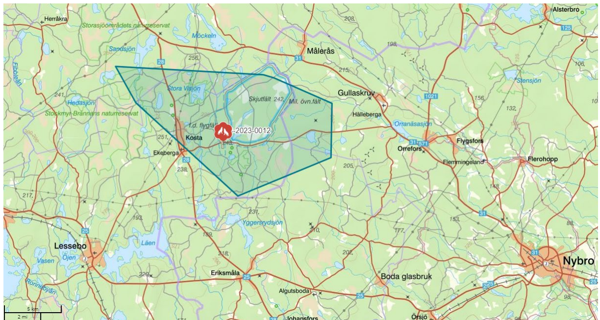
Figur 1. Karta över DNA-baserad baspolygon för vargreviret vid Kosta som dokumenterats under inventeringssäsongen 2022/2023. Utdrag från Rovbase.se.