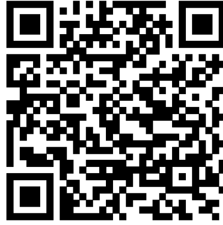
Figur 2. QR-kod för Google Play.

Vill man veta mer om själva inventeringsmetoden finns det mer info på länken nedan. Notera att det finns vissa skillnader såsom att numrering av provytor och traktnamn skiljer sig åt. Metodiken i grunden är dock den samma.