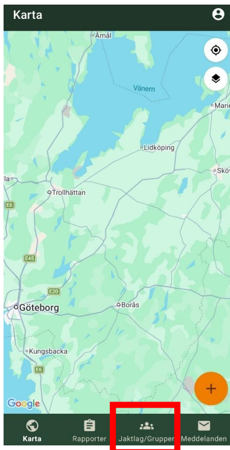
Figur 3. Klicka på Jaktlag/Grupper.

Jaktlags-/appnycklar ges ut på ÄFO-nivå. Det innebär att samtliga jaktområden inom respektive ÄFO anger samma nyckel. Jaktlags-/appnyckeln skriver ni in i rutan “Lägg till grupp/Jaktlag” i Viltdata-appen. Jaktområden som gränsar med ett annat ÄFO kan behöva ange två nycklar. Se Exempel A under kapitlet ”Namngivning av trakter”.