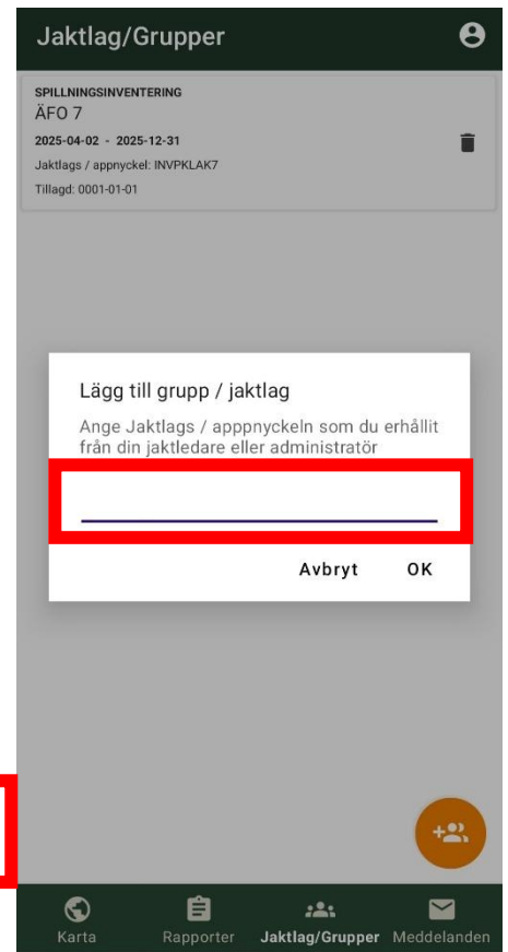
Figur 5. Skriv in nyckeln för aktuellt ÄFO. Nyckeln hittar du i tabell 1.

Appnycklar anges i tabell 1. Se nästa sida.