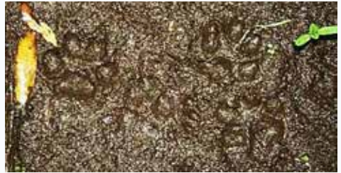
Mårdhundens spår är symmetriskt och i det närmaste cirkelrunt.

Mårdhundsspåret är runt som ett stort kattspår, detta gäller både fram- och bakfot. Hos de andra hunddjuren är bakfoten mer samlad, oavsett underlag. För övrigt ser Mårdhundens spår ut som ett typiskt hundspår, d.v.s. med avtryck efter 4 tår, hos mårddjuren, t.ex. grävling syns 5 tår. Mårdhundens spår är symmetriskt och vanligtvis med tydliga klomärken, hos kattdjuren asymmetriskt och utan klomärken. Mårdhundsspåret är 4 - 5,5 cm i diameter, och framfoten är något större än bakfoten. På grund av de korta benen ligger spåren inte på linje som hos räven. Steglängden är kort (40-60 cm), i raskare trav ökar steglängden.