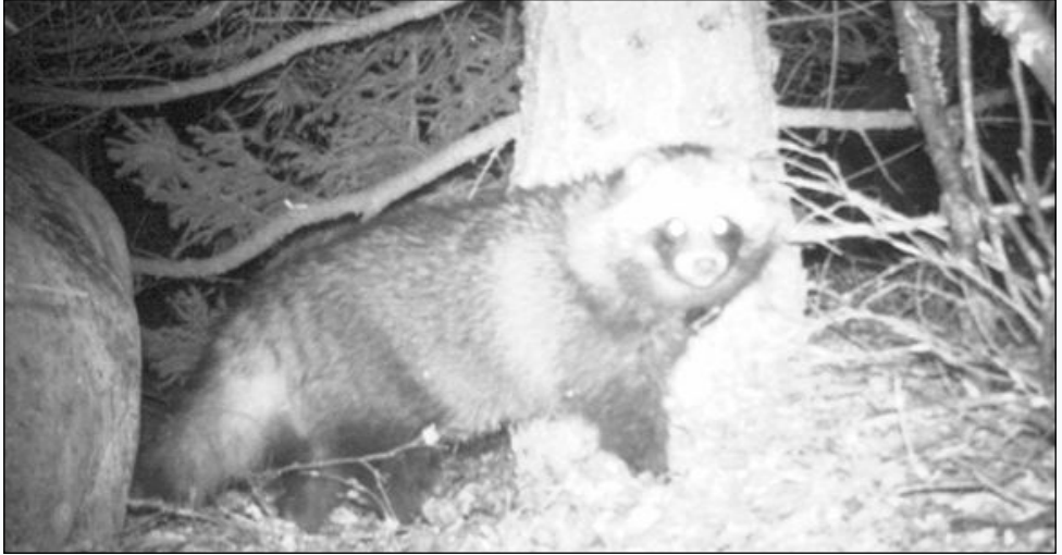
Bild av mårdhund. Lägg märke till de korta benen, korta svansen och korta öronen.