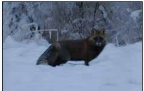
Korsräv, en mörk variant av rödräven