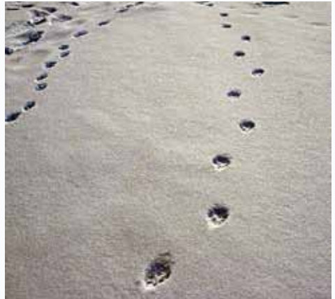
Mårdhundarna uppträder oftast parvis, därför finner man ofta spår efter två djur. Steglängden är avståndet mellan tåpetsen på ett spåravtryck till nästa tåpets på samma fot (jmf. Pilen).