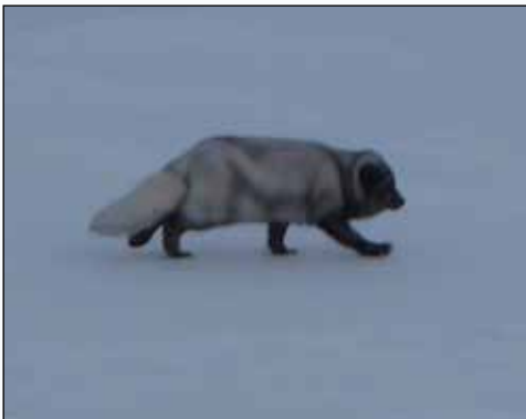
Grävling (överst) och tvättbjörn (förrymda individer förekommer sporadiskt ute i det fria)