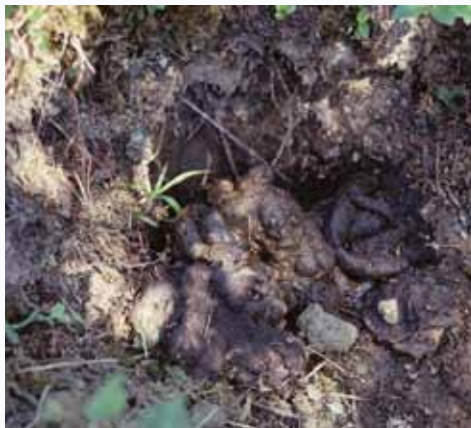
Bild av mårdhundlatrin överst och grävlinglatrin nerst.