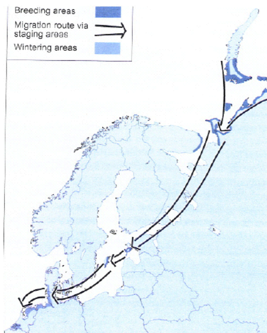
Sträckväg för den Arktiska populationen av vitkindad gås. Häckningsområden i Sibirien och övervintring i Danmark och Holland (Från Madsen et. al. 1999)

Det gotländska beståndet uppgick 2005 till ca 4 400 par men minskade drastiskt till säsongen 2006 till ca 2 700 par (Kjell Larsson muntl.). Orsaken är främst att en stor koloni (1 100 par) uttraderats p.g.a. räv. Beståndet på flera häckningsöar har troligen nått sitt maximum och regleras nu av täthetsberoende faktorer (Larsson & Forslund 1994). Huvuddelen av de gotländska gässen lämnar Gotland i slutet av september (Kjell Larsson muntl.) Hela den arktiska populationen passerar Östersjön under flytten (se karta) och dagsiffror om strax under 100 000 sträckande gäss förekommer nästan årligen utmed Ölands eller Gotlands östkust (SOF 2003, 2002, 2001, 2000).