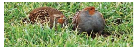
Agerhønen æder meget mere frø og korn om foråret. (Hammer 1955)

Men hvad med agerhønsene? Hammers agerhøneundersøgelser fra 1955 viser helt utvetydigt, at korn og frø spiller en langt større rolle i føden om foråret end om vinteren.