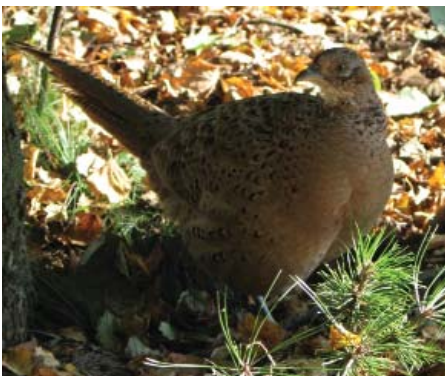
I yngletiden færdes fasanerne ude i det åbne land.

Engelske undersøgelser foretaget af GCi 16 udvalgte landbrugsområder i Syd- og Østengland viser imidlertid, at det moderne landbrug med sine store vintersædsmarker udgør et meget dårligt spisekammer forud for ynglesæsonen. Når jægerne så samtidig anvender den forkerte fodringsteknik, kan det ikke undgås, at det får en meget negativ virkning på ynglesuccesen, konkluderer GC