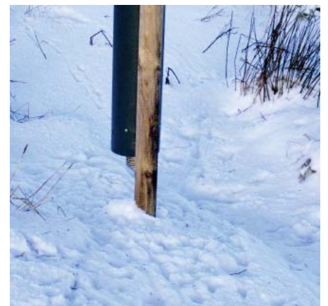
Det er bedre, at fuglevildtet finder kråseflint ved automaten end i vejkanterne.

Tørt sand kan også blandes i mellem kornet.