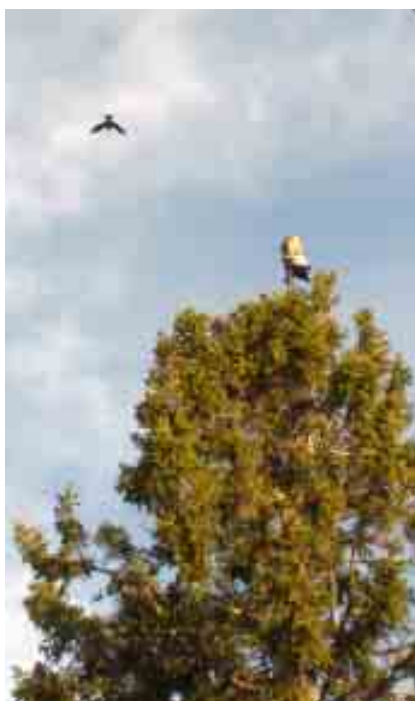
Första kråkan hann bara göra ett varv kring uven innan den föll till marken.

Mer allvarsamt blev det när några korpar började slå mot uven, den ena så närgånget att uven tappade fjädrar vilket föranledde några glödande svor-