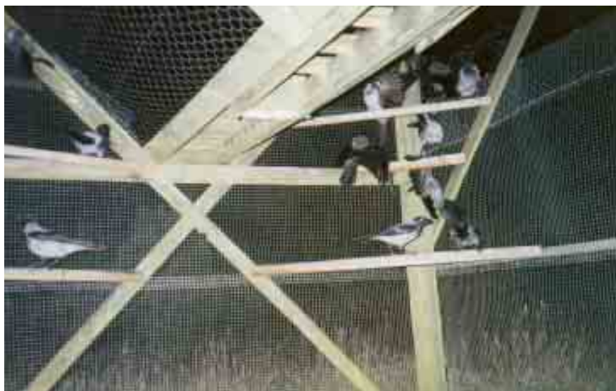
Fällan vittjas inte förrän det blivit mörkt.

I länsjaktvårdsföreningarnas regi byggdes norska kråkfällor över hela landet och erfarenheterna redovisades noggrant i Svensk Jakt. Åtskilliga kråkors livssaga slutade i dessa burar och