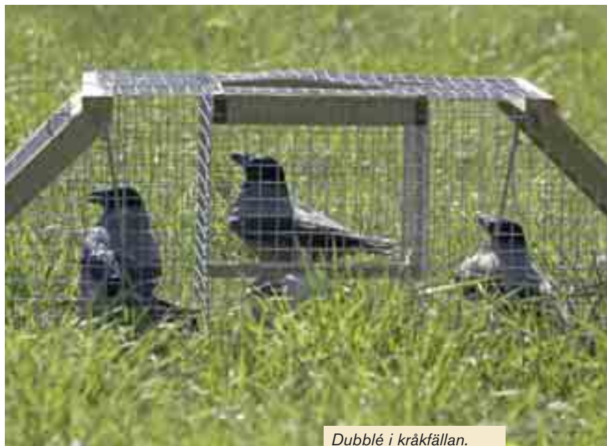
Dubblé i kråkfällan.

Fällornas ringa storlek är en viktig detalj eftersom fångsttekniken bygger på att de ska flyttas runt i markerna. De här uppräknade fällorna får ledigt plats