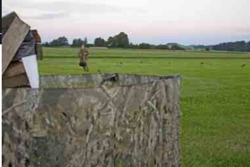
Klaus Demmel använder ett enkelt skärmgömsle som i det här fallet placeras mot en vedtrave i kanten av fältet.

Dock icke denna morgon. Det blev alltmörklert att kråkorna inte bara tog det lugnt, utan att de måste vara någon