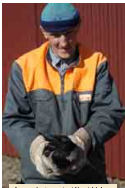
Att använda en lockfågel i jakten på revirkråkorna är effektivt.