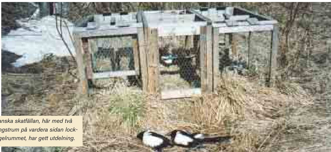
Danska skatfällan, här med två fångstrum på vardera sidan lockfågelrummet, har gett utdelning.

Av våra kråkfåglar är skatan kanske den som är svårast att komma åt genom vanlig jakt. Däremot är den lätt att fånga. Fångstrekordet i en dansk skatfälla är nio skator på samma plats och dag.