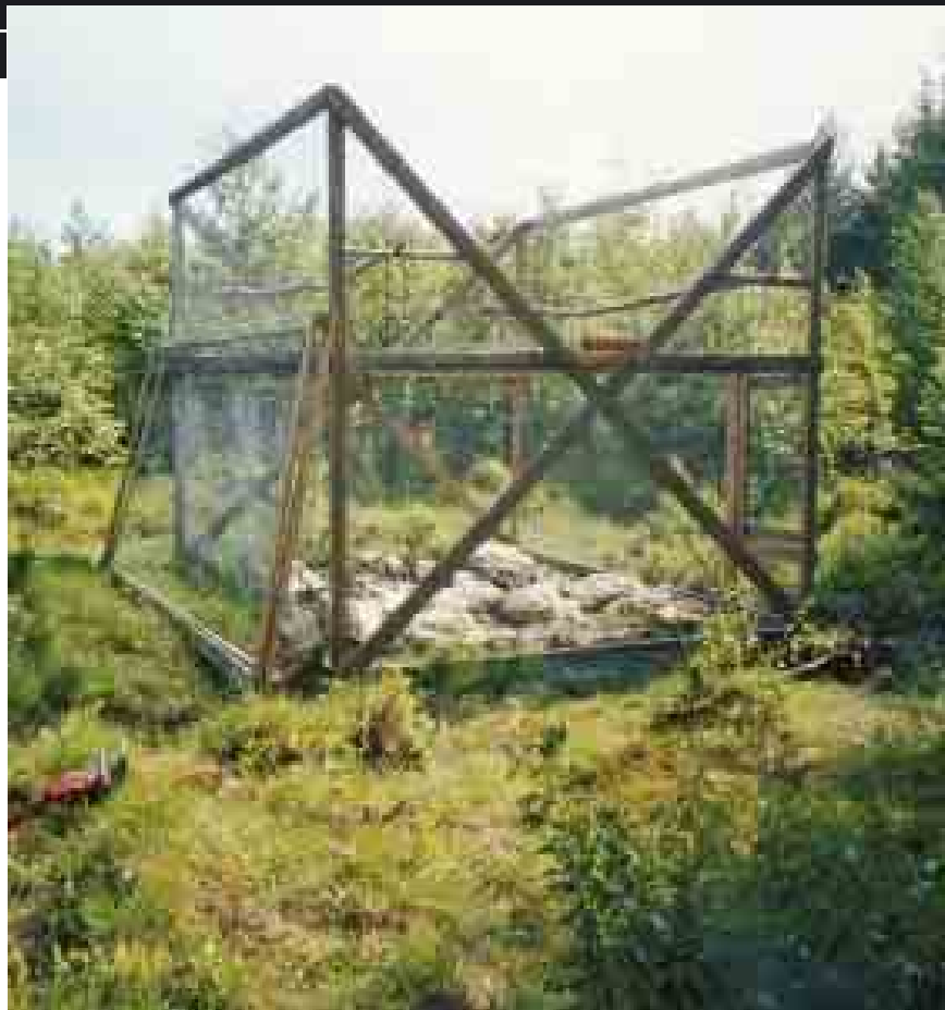
När inmatningsperioden börjar ska takhalvorna lyftas bort och fällan stå helt öppen. Fällan ska placeras relativt öppet men ändå störningsfritt, exempelvis i skogsbryn mot åker.

äta. Lämpliga fångstplatser brukar vara vid soptippar, åkerholmar och sjökanter.