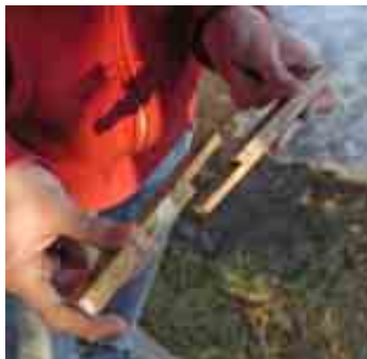
Den tvådelade gillerpinnen i den danska skatfällan håller fångstluckan i uppspänt läge. När skatan hoppar ned på pinnen viker den sig varefter luckan slår upp och stänger för öppningen.