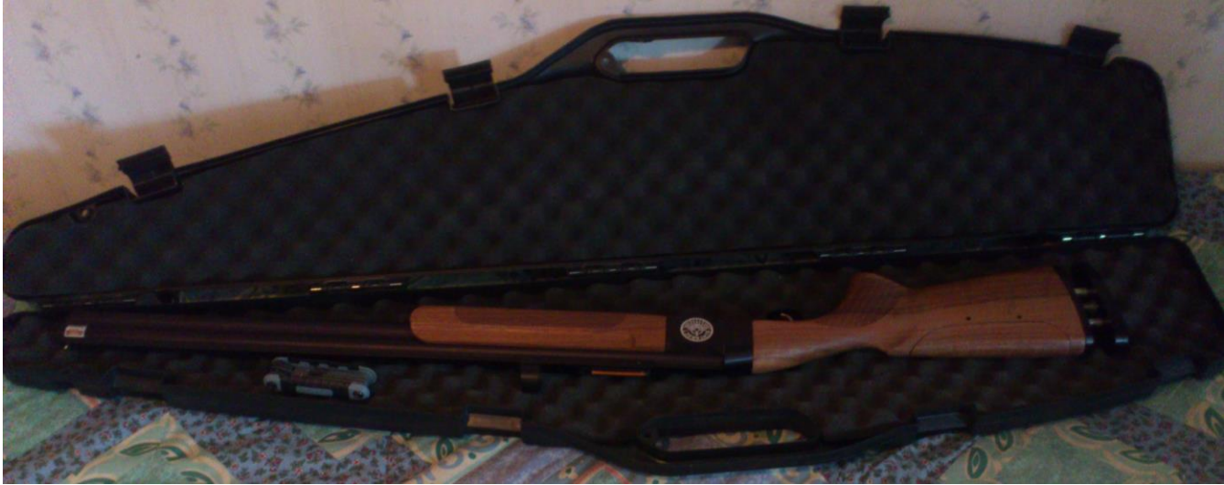
1 st attrapp hagel, 1 sats Insexnycklar, 1 st Easyhit sikte hagel