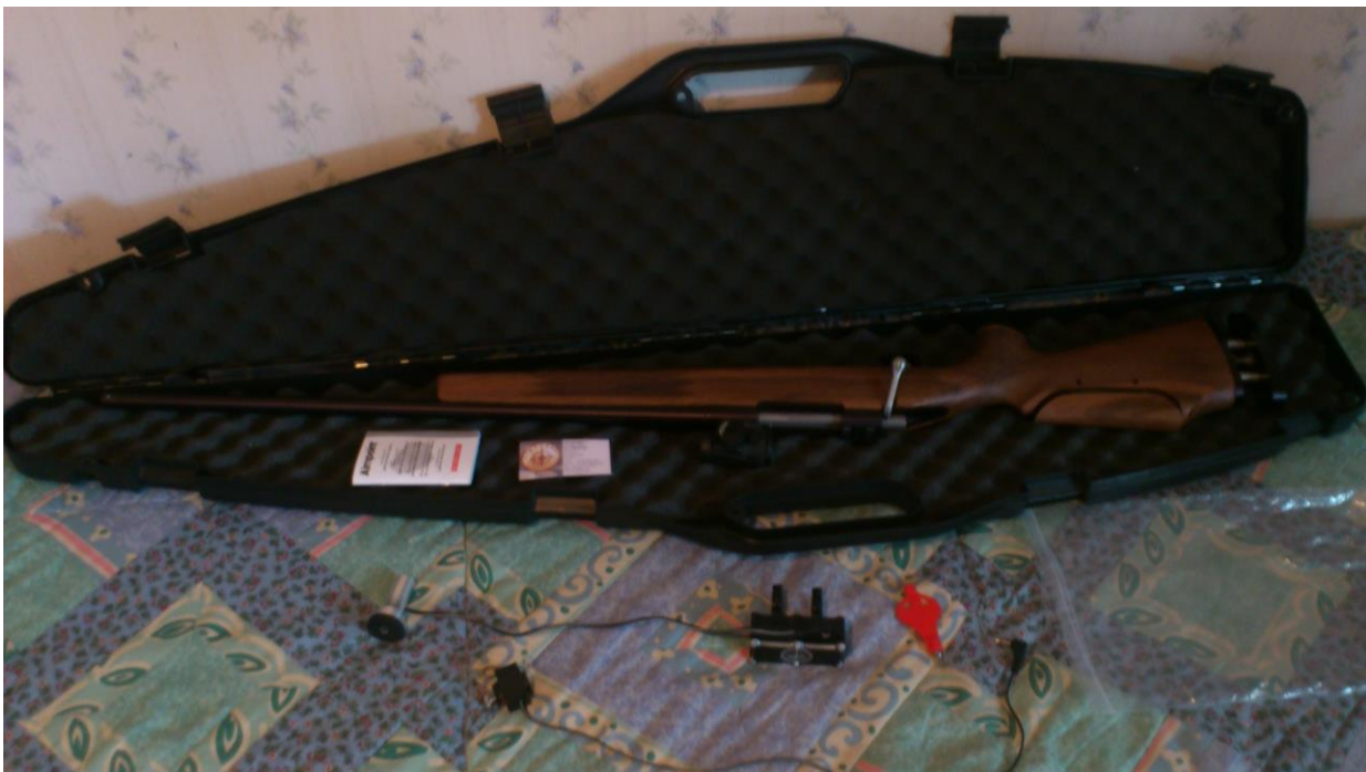
1 st attrapp kula, 1 st enhet för riktiga gevär (avtryckare, laser, sänd enhet) 1 st Aimpoint sikte, 1 st nyckel till Aimpoint,