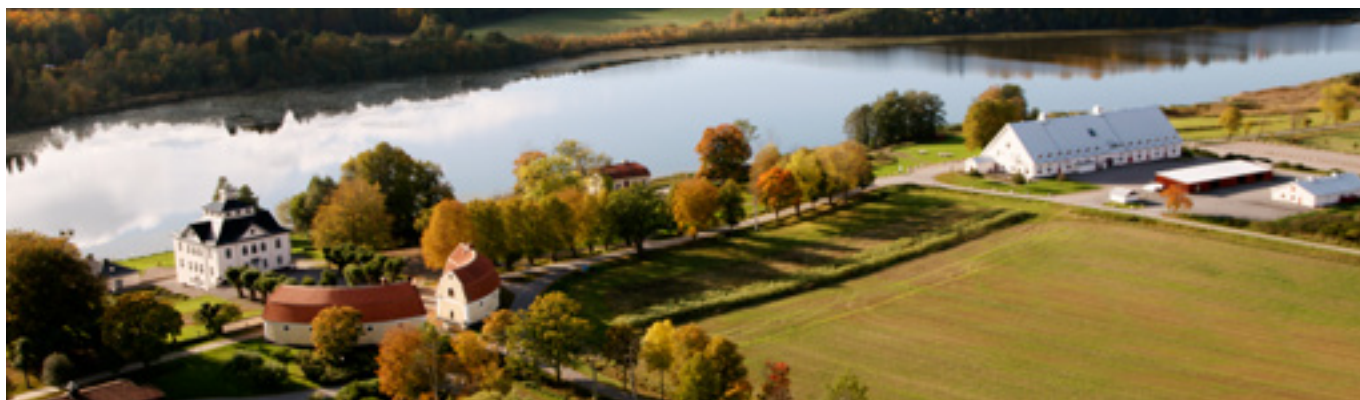
I HJÄRTAT AV SÖRMLAND HAR ÖSTER MALMA BLICKAT UT ÖVER MALMASJÖN I 350 ÅR.

Gården har ca 1200 ha mark, varav 560 ha är produktiv skogsmark. Drygt 350 ha sjöar, viltvatten och vattendrag. Resten är åker, äng och övrigt. Åkermarken är till stor del utarrenderad. Förutom den egna marken arrenderas ytterligare ca 800 ha skogsmark som i huvudsak används för utbildningsjakter.