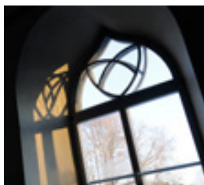
GROENS NYGOTISKA SPETS- BÄGAR, OMKRING 1830.