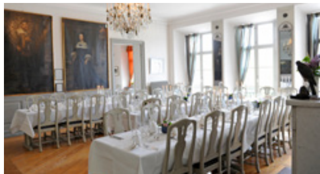
BAROCKSLOTTET BJUDER IDAG PÅ EN ROMANTISK INRAMNING TILL BRÖLLOPSMIDDAGAR OCH ANDRA FESTER.

Resultatet blev Laggårn som vi ser den idag och av Röda Längan blev ett modernt hotell för övernattande gäster.