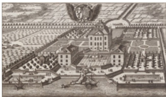
SÄTERIET ÖSTER MALMA I BÖRJAN AV 1700-TALET.